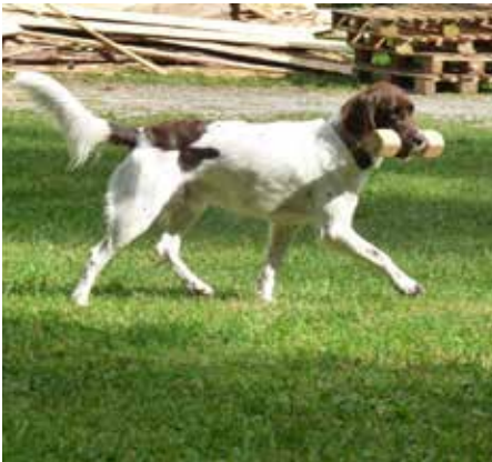
Zuchtrüde Chester vom Steinauertal

ich alles mitbekomme und beim jeweiligen Dislozieren den Anschluss nicht verpasse!