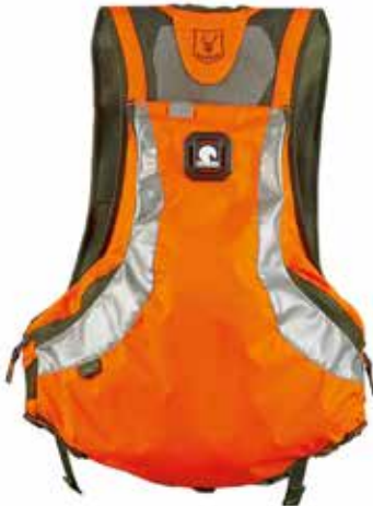
Oranger Rücken mit Reflektionsstreifen: R2071