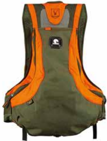
Grüner Rücken mit Orangen Streifen: R2045

Generalimporteur CH & FL: BLASER HANDELS GmbH, 033 / 822 86 81, www.blaser-handels.ch Preis und Artikeländerungen vorbehalten