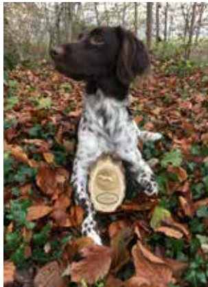
Titelbild: Eika vom Stanserhorn von Walter Häller