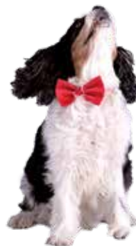
Spürt den Frühling auch schon... Redaktionshund Aramis