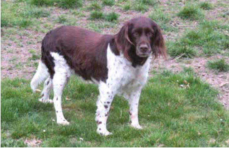
Cara vom Roggenhorn von Hans Bolzli