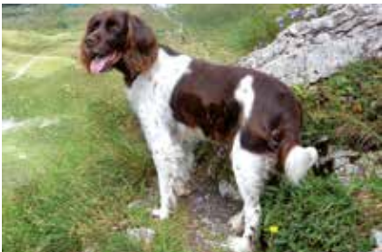
Titelbild: Cara vom Roggenhorn von Hans Bolzli, gesunde 15-jährige Hündin